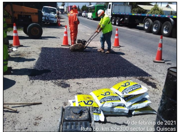
Trabajos de bacheo en sector Las Quiscas, comuna de Las Cabras