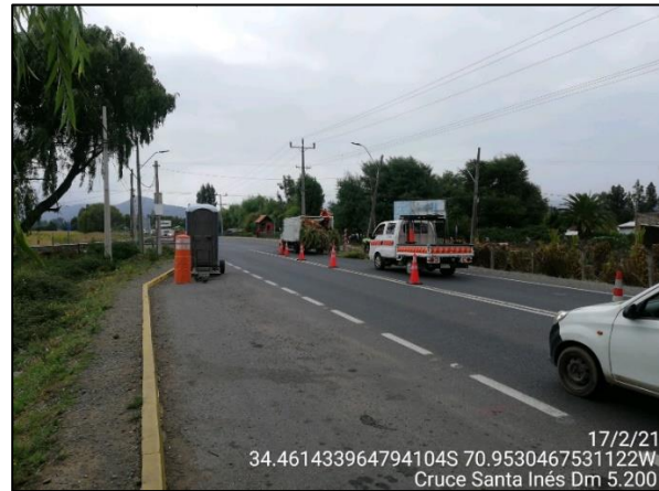
Trabajos de poda en sector Cruce Santa Inés, comuna de Malloa