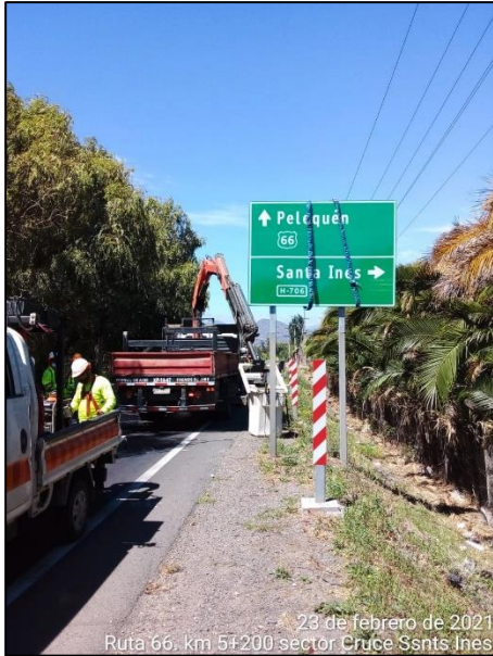
Trabajos de instalación de señales en sector Cruce Santa Inés, comuna de Malloa