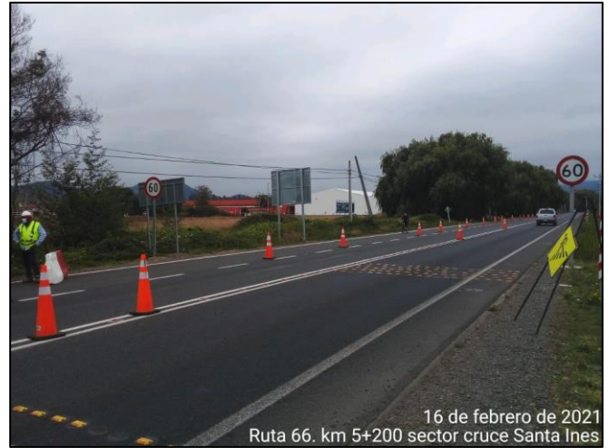
Trabajos en sector Cruce Santa Inés, comuna de Malloa